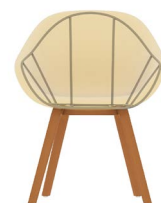
Petita 4 potes