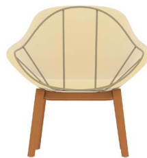
Gran 4 potes