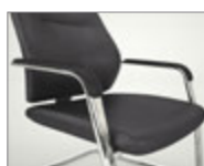
Brazos con apliques tapizados. Braços amb detall entapissat / Accoudoirs avec manchettes tapissées / Upholstered armrest / Gepolsterte Armauflage