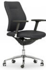
Respaldo medio. Respatller mitjà / Dossier moyen / Medium backrest / Mittlere Rückenlehne.