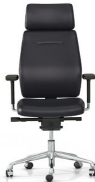
Cabezal fijo y respaldo fijo. Capçal i respalller fix / Tètière et dossier fixe / Fixed headrest and backrest / Feste Kopfstütze und Rückenlehne.