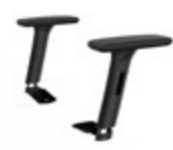
Brazos regulables 3D Braços regulables 3D / Accoudoirs réglables 3D / 3dHeight-adjustable arms / Höhenverstellbare Armlehnen