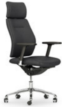
Silla de dirección. Cadira de direcció / Siège de direction / Executive chair / Chefessel.