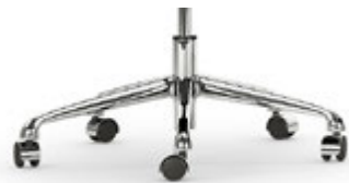
Base en aluminio pulido Base en alumini polit / Base en aluminium poli / Polished aluminium base / Fußkreuz Aluminium poliert.