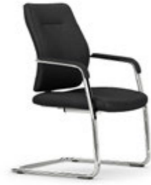
Balancín. Confident / Luge / Cantilever / Freischwinger.