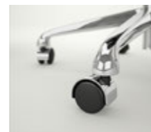
Ruedas dobles Ø 50 mm Rodes dobles Ø 50 mm / Roulettes doubles Ø 50 mm / Double wheels Ø 50 mm / Doppelaufrollen Ø 50 mm.