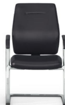
Respaldo fijo. Respalller fix / Dossier fixe / Fixed backrest / Feste Rückenlehne.