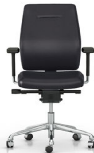
Respaldo fijo. Respalller fix / Dossier fixe / Fixed backrest / Feste Rückenlehne.