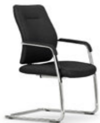
Estructura cromada. Estructura cromada / Structure chromée / Chrome frame / Gestell Verchromtes.